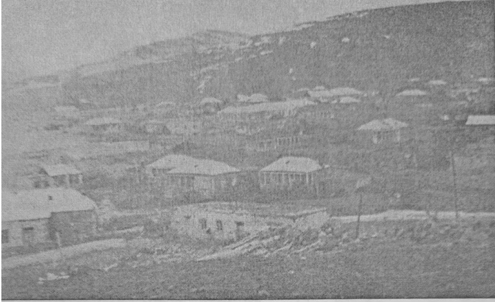
Böyük Qaraqoyunludan bir görüntü...