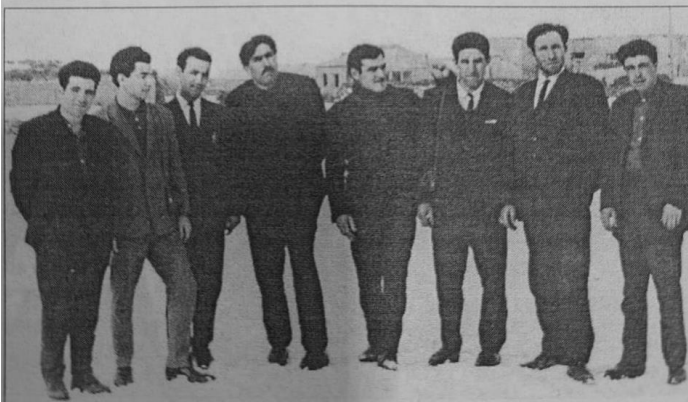
Böyük Qaraqoyunlu məktəbinin müəllimləri qarlı bir qış günündə, 1969