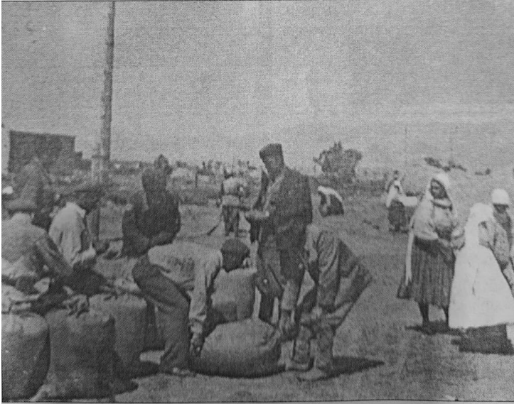
XX əsrin 40-cı illəri Böyük Qaraqoyunlu kolxozunun ən qaynar dövrləri idi ...